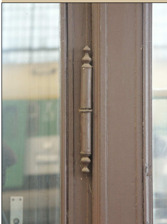
dveřní závěs s ozdobnými konci