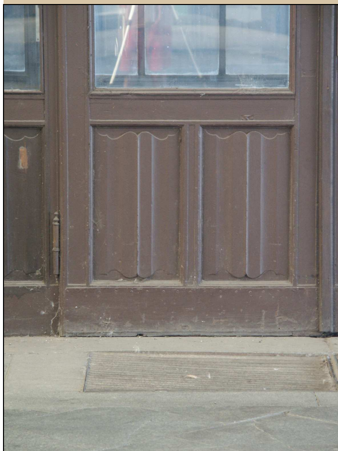
kazetové pole s vlnkovým ukončením