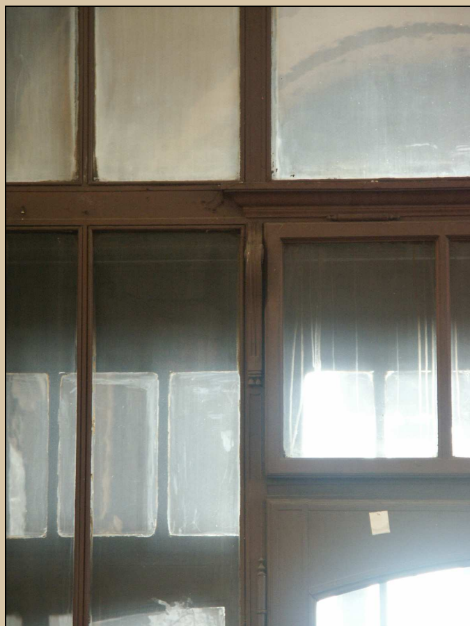
detail profilace poutce s konzolkami